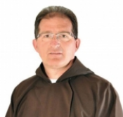
Nomina del Vescovo di Bagé, Brasile