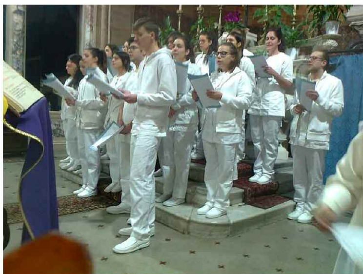
s Messa degli studenti scuola Convitto