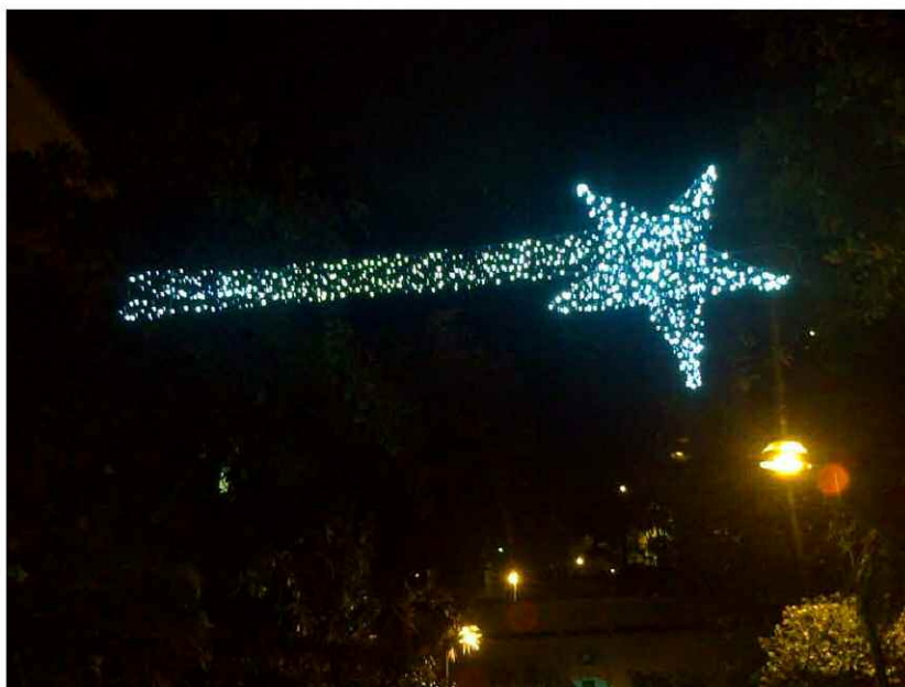
La cometa è passata da Ospedale san Martino